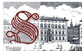
Senato della Repubblica »